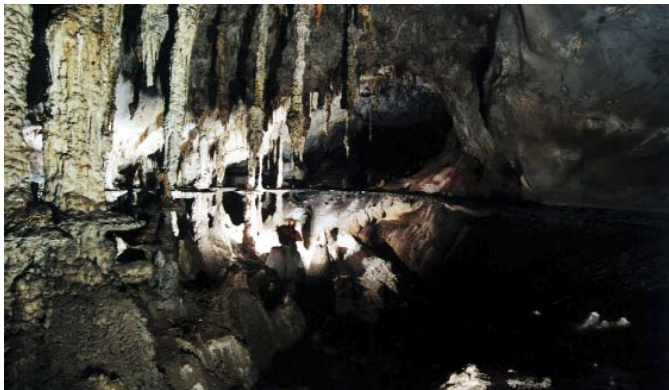
Salão dos Discos Voadores - Toca da Boa Vista

Embora as cavernas da região sejam muito pouco visitadas, julga-se necessário que algumas áreas mais frágeis sejam demarcadas com fitas, evitando que ocorra pisoteamento em espeleotemas ou feições no solo. Desta forma estaremos promovendo visitas para efetuar estas demarcações.