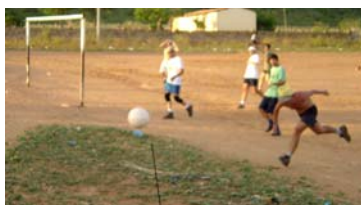
Jogo de futebol em Lages dos Negros