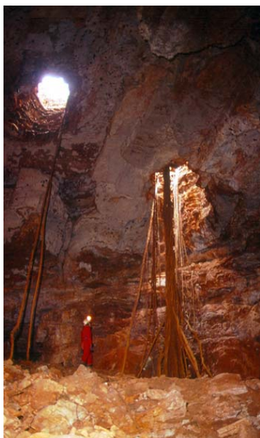
Abismo do Bode - Toca da Boa Vista

Esta atividade ficará em contínua exposição em Laje dos Negros e estará aberta a todos os participantes.