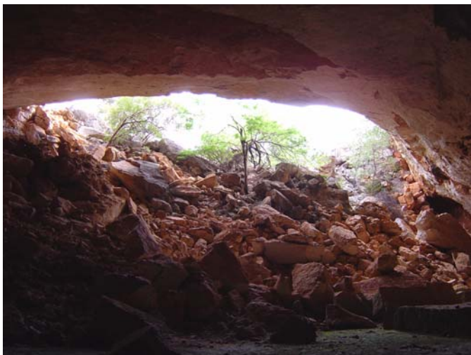
Entrada - Lapa do Convento

Esta atividade será ofertada provavelmente duas vezes durante o evento.