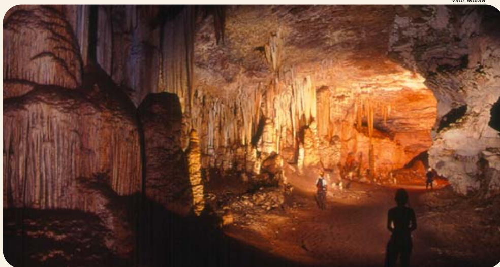
Toca da Boa Vista

Esta atividade será ofertada ao menos uma vez durante o evento.