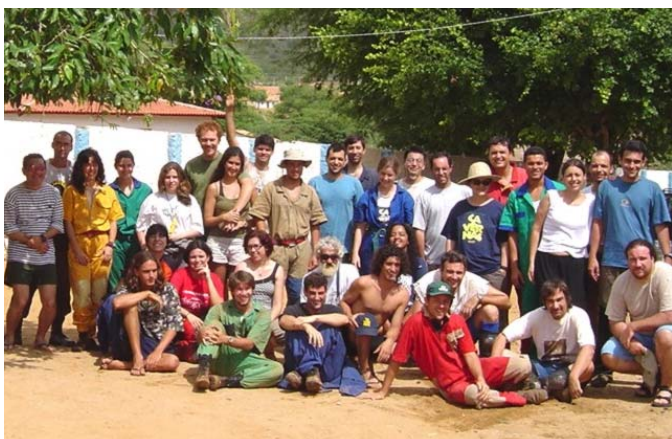
Equipe Toca da Boa Vista 100 km - 2003

Em 2007 completa-se 20 anos desde que uma expedição pioneira, em 1987, iniciou os trabalhos de mapeamento na Toca da Boa Vista. O Espeleo 2007 será um evento comemorativo, durante o qual os participantes terão oportunidade de vivenciar um pouco do mais antigo e contínuo projeto espeleológico brasileiro.