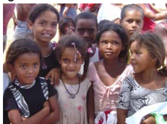
Crianças em Lages dos Negros

Durante os dias de folga, serão organizadas excursões de lazer para as cachoeiras da região. A tradicional partida de futebol também será realizada, confrontando os casados (ainda invictos) contra os solteiros.