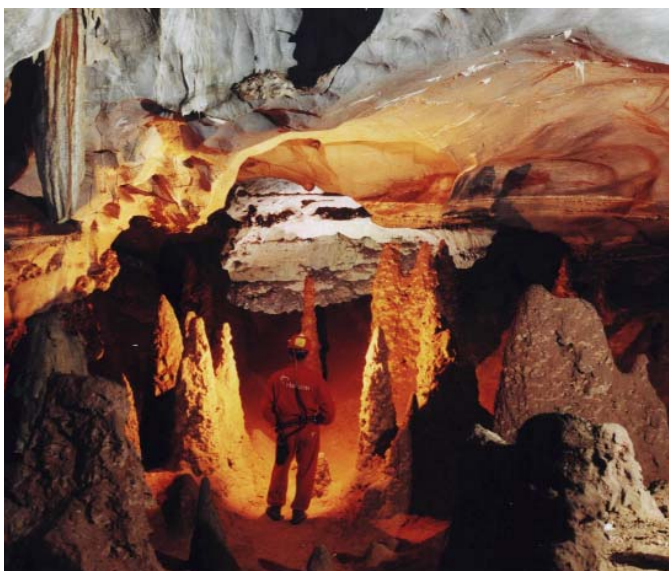
Salão dos Vulcões - Toca da Boa Vista

20 anos de Toca da Boa Vista Campo Formoso - Bahia